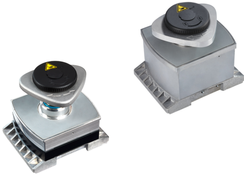
Fijaciones mecánicas VCMC-K2-QUICK