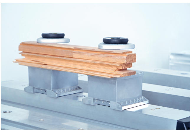
Fijación mecánica VCMC-K2-QUICK fijando marcos